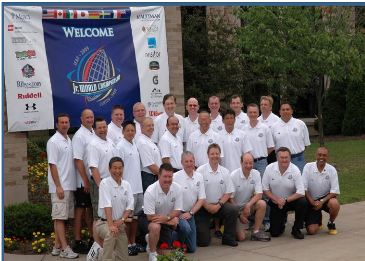
Den samlede dommertrup fra sommerens U19 VM Canton, Ohio - sommeren 2009