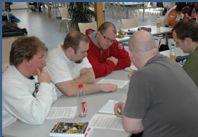
Dommerholdet kan hente meget, ved at samarbejde uden for banen Elitedommerkursus Frederikssund 2007

Det er helt frivilligt og helt gratis, så hvad venter du på? :-)