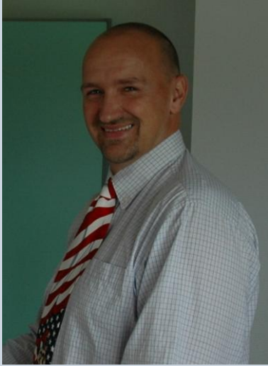
NL assigneren bliver væsentlige gladere, jo flere gode kollegaer han har at samarbejde med