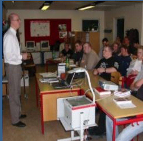
Basis modul i DAFF's dommeruddannelse kommer hele vejen rundt, og forholder sig til de fleste emner, du som dommer kan komme ud for.

Kurset er udformet i stil med den normale pre-game procedure, vi som dommere, går igennem hver gang inden en kamp. Heri kig på påklædning, møde på kampstedet, faciliteter, udstyr, baneeftersyn, coin toss procedure, kick off (free kicks), normal scrimmage downs, løbspil, kastespil, punt, andre scrimmage kicks, timeouts, tidstagning, brug af flag, indrapportering af penalties, udmålingsprocedure, measurement, kædehold, bold drenge, signalering, announcements men naturligvis vil der også bliver dækket specifikke regler, som f.eks. pass interference.